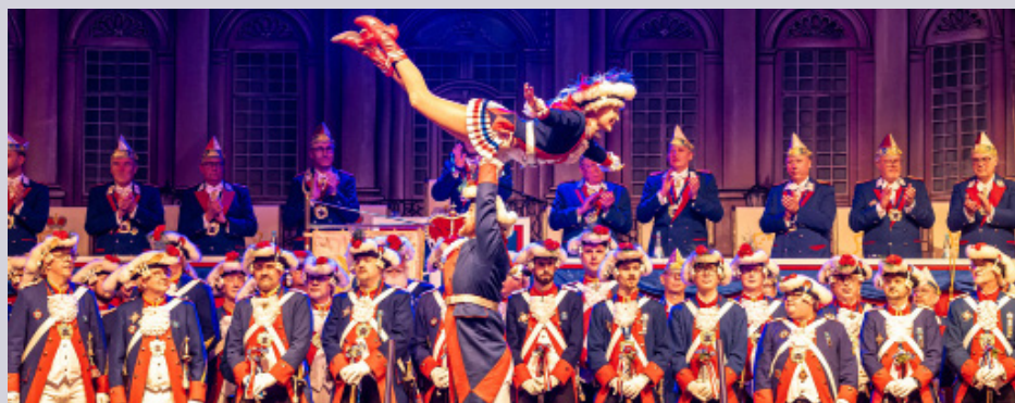
Bonner Stadtsoldaten Corps 1872 e.V.