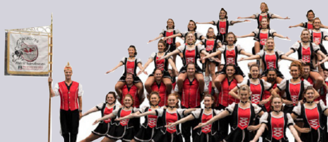
Tanzcorps Fidele Sandhasen e.V.