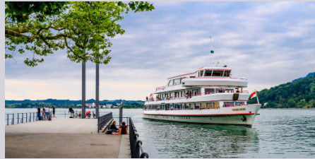
Rundfahrt Bregener Bucht